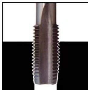
RE@EWE NA NAVOJ