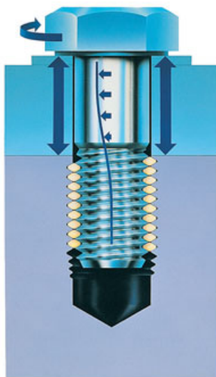
SO NAVOEN VMETOK