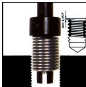
MESTEWE NA VMETOKOT